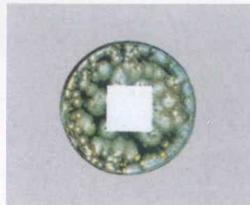
アクリル系エマルジョン塗料