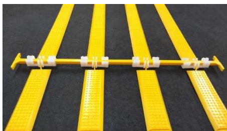
連4か所固定すると